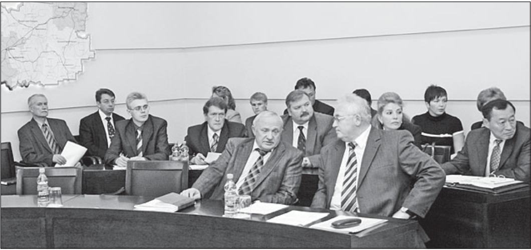
Участники совещания всегда высказывались в поддержку проекта.