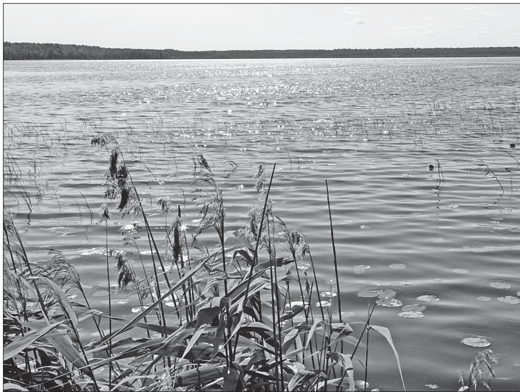
Это озеро Черное. Мало кто знает, что вот уже 66 лет на его дне покоится самолет времен Великой Отечественной войны.

- Сбрасывали в воду с самолетов мешки с песком, - продолжает Федулинский. - Надо же было