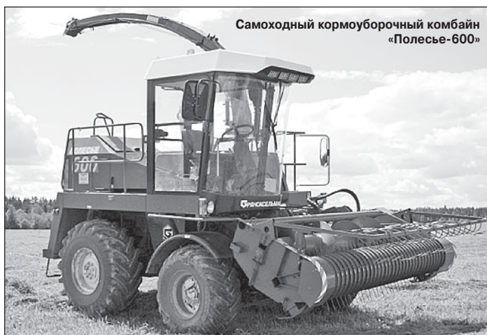
Самоходный кормоуборочный комбайн «Полесье-600»

собна конкурировать с техникой других производителей?