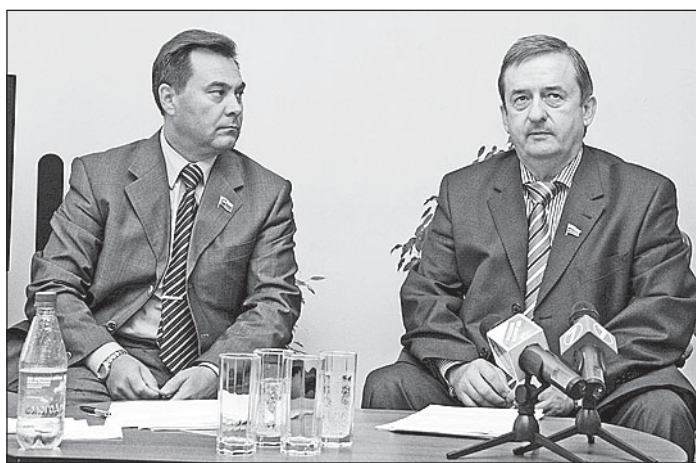
На встрече с представителями деловой общности областного центра депутат Государственной Думы, секретарь политсовета регионального отделения партии «Единая Россия» Георгий ШЕВЦОВ отметил, что в России в последнее время наметился реальный сдвиг для благоприятного развития малого и среднего предпринимательства.

По его мнению, в последнее время в стране наметился реальный сдвиг по созданию «дружественных» отношений для развития малого и среднего предпринимательства.