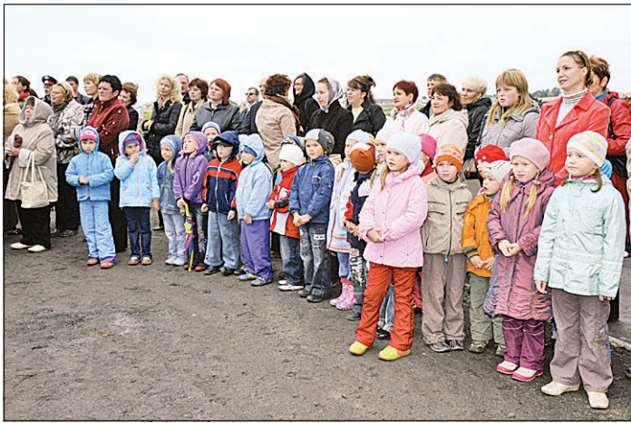
Пусть все дети будут счастливы и здоровы!