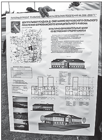
Под строительство ОКЦ отведена площадь в 2700 квадратных метров.

- Ну что это такое творится? - разводит руками Губернатор. - Потребность в лыжном инвентаре давно подсчитана,