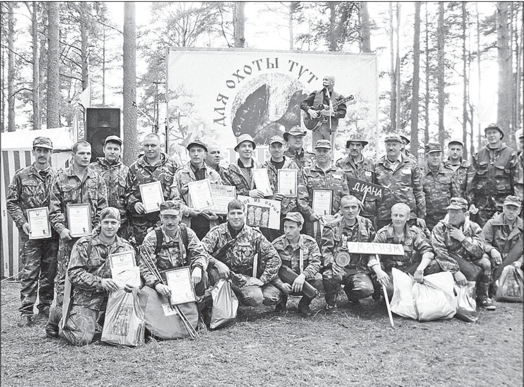
Как здорово, что все мы здесь сегодня собрались!

Далее все действо проходило на глазах не только судей, но и зрителей. Охотники выполняли непростые задания: переправлялись через «болото», кидали кольца на «рога лося» (причем из 27 человек попал только один!), кидали шишки в корзину, закрепленную