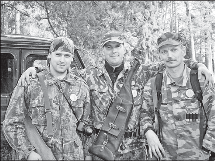
Команда «ВВС» из Вытегры завоевала «серебро» и лицензию на кабана.

на сосне, преодолевали «лабиринт», бревно, проползали под сеткой и несли на толстой палке «дичь» - третьего участника, показывали знания в медицине - оказывали первую помощь «раненому».