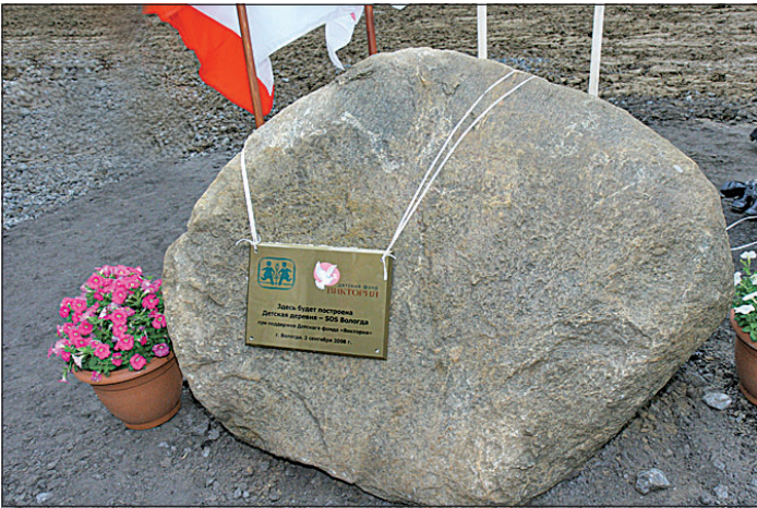
Детская деревня появится в Вологде уже через полтора-два года.