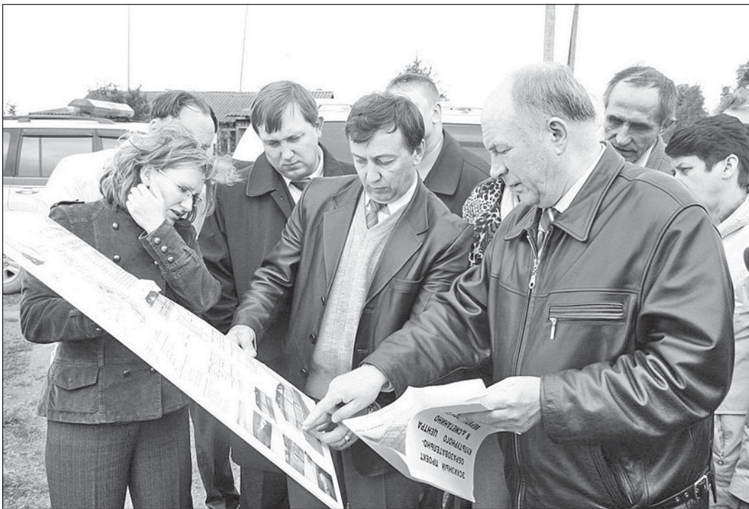
Глава области знакомится с проектом образовательно-культурного центра.

Также Вячеслав Позгалев интересуется наличием в Верховской СОШ «школьного» молока, которое каждый день должны получать учащиеся младших классов, условиями его доставки. Молоко в наличии есть (Губернатор лично убеждается в этом, заглядывая