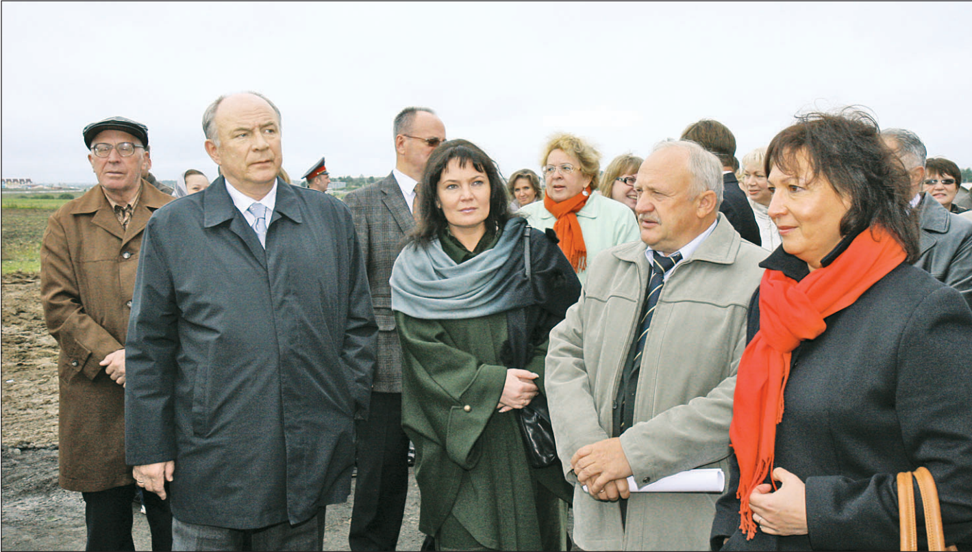
Губернатор Вячеслав ПОЗГАЛЕВ: «В детской деревне ребята будут воспитываться в естественных, наиболее приближенных к семейным условиям».