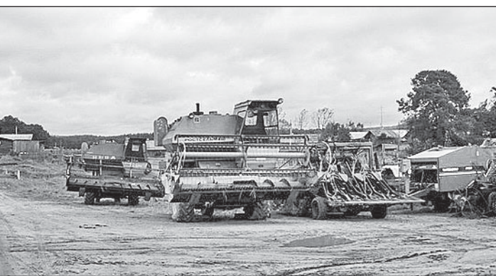
Село Сметанино Верховажского района.