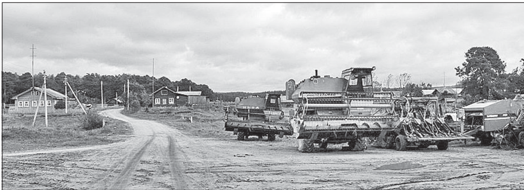
Село Сметанино Верховажского района.

20 миллионов рублей для его приобретения школам области выделено, все докладывают, что лыжи закуплены, а куда ни приеду - или лыж вообще нет, или нет их полного комплекта.