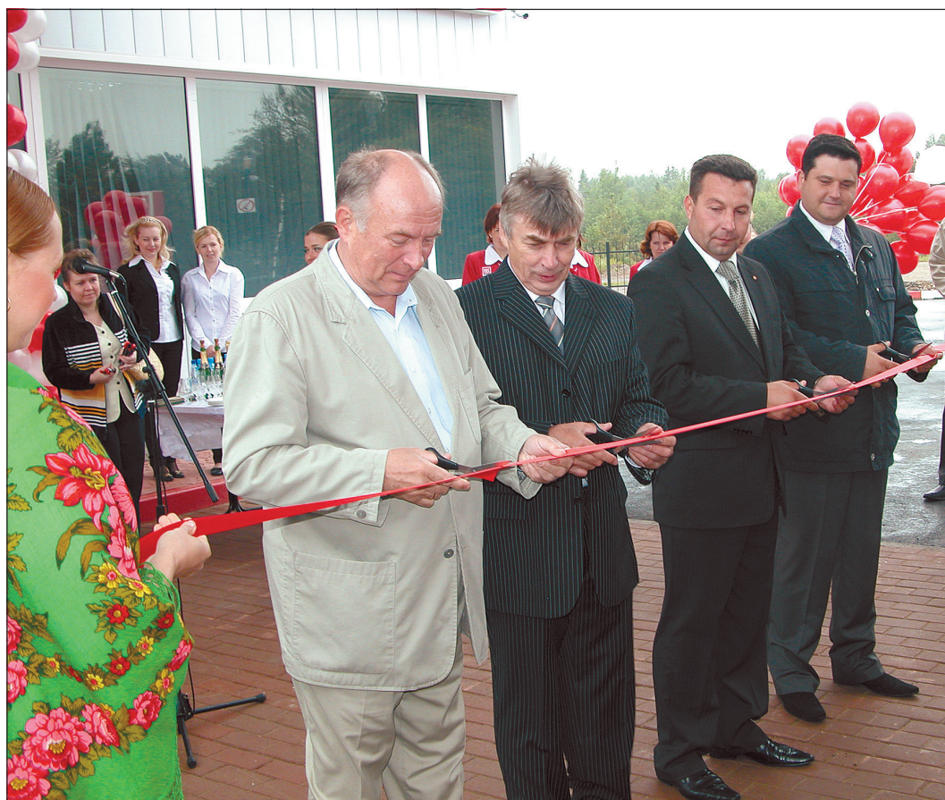
На церемонии открытия автозаправочной станции.