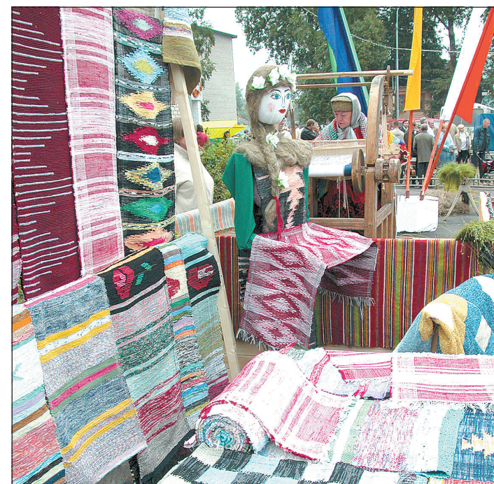
Символом выставки-ярмарки стал домотканый пологик.