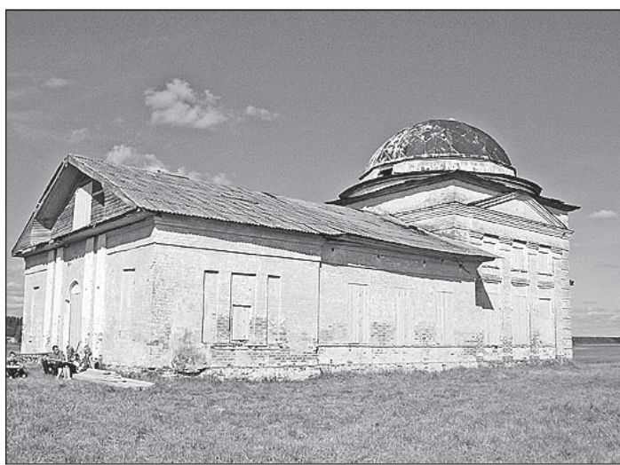
Благовещенская церковь находится в запустении.

ликий Устюг и дальше, к Белому морю. Местные жители занимались речным судостроением, извозом по Солигаличскому тракту и земледелием. Толшменская земля издревле славилась своей историей и культурой. Но прежде всего она была богата людьми-тру-