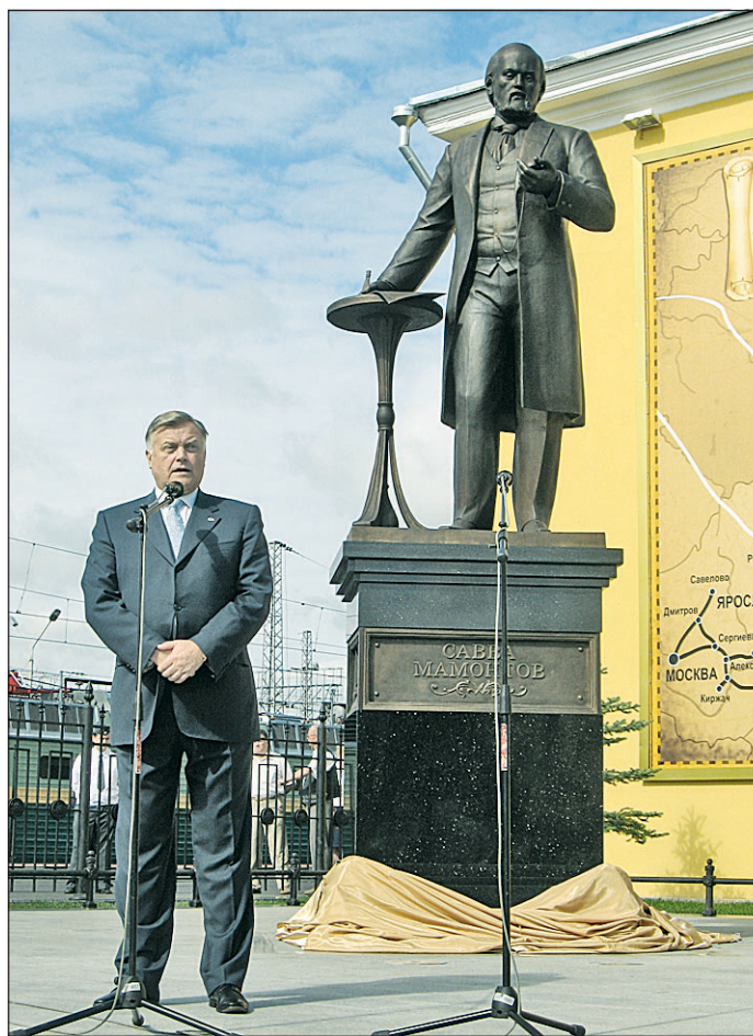
Президент ОАО «РЖД» Владимир ЯКУНИН на открытии памятника Савве Мамонтову.