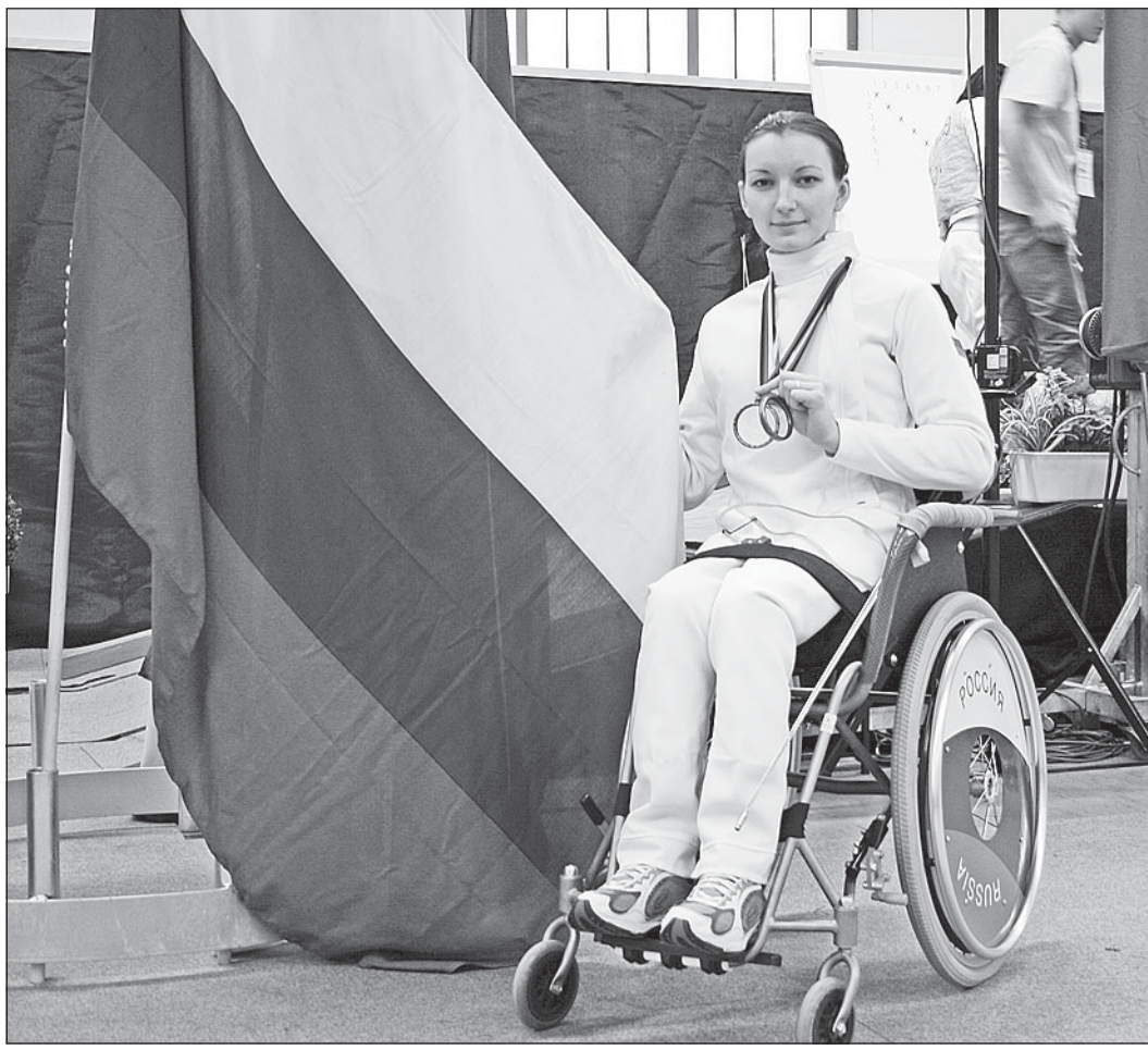
Две бронзовые медали на кубке мира в Мальхове. Германия, 2008 год.

Светлана ОНЕГИНА, наш собственный корреспондент. Белозерск.