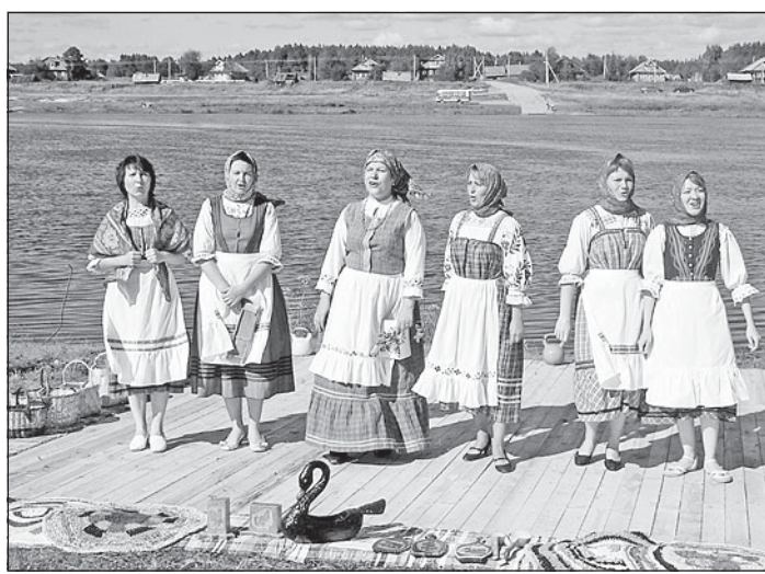
Музейный ансамбль «Покрова».

В 60 километрах от Тотьмы реку Сухою впадает небольшая речка Толшма. Деревни, расположенные по берегам