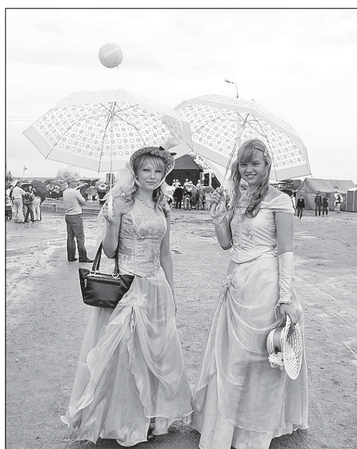
Несмотря на дождь, в Шексне были замечены настоящие тургеневские девушки.

Было время, когда общерайонные праздники в Шексне прочно ассоциировались с неизменными конскими бегами на ипподроме. Но все течет, все изменяется. Ипподрома давно уже нет, теперь на этом месте горделиво возвышается крытый ледовый каток. Да и сам праздник, именуемый теперь ярмаркой «Шексна и XXI век», из исторического центра переместился в северную часть поселка, поближе к акватории Шексны-реки, с возможностью устраивать различные водные забавы.