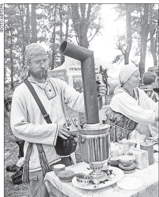
Во время ярмарки каждое шексинское поселение стремилось привлечь покупателей чем-нибудь необычным.