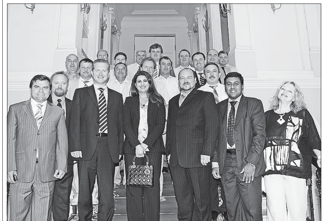
Встреча с представителями бизнеса Вологодской области в Клубе делового общения.