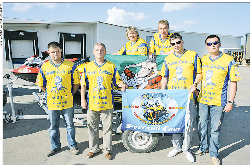
Перед дальней дорогой.

«В этом году исполняется 360 лет со дня рождения известного путешественника Семена Дежнева, исследователя Сибири и побережья Северного Ледовитого океана, совершившего ряд походов от Якутска по рекам Индигирка, Колыма, Анадырь, Лена, Вилюй. 12 июля из