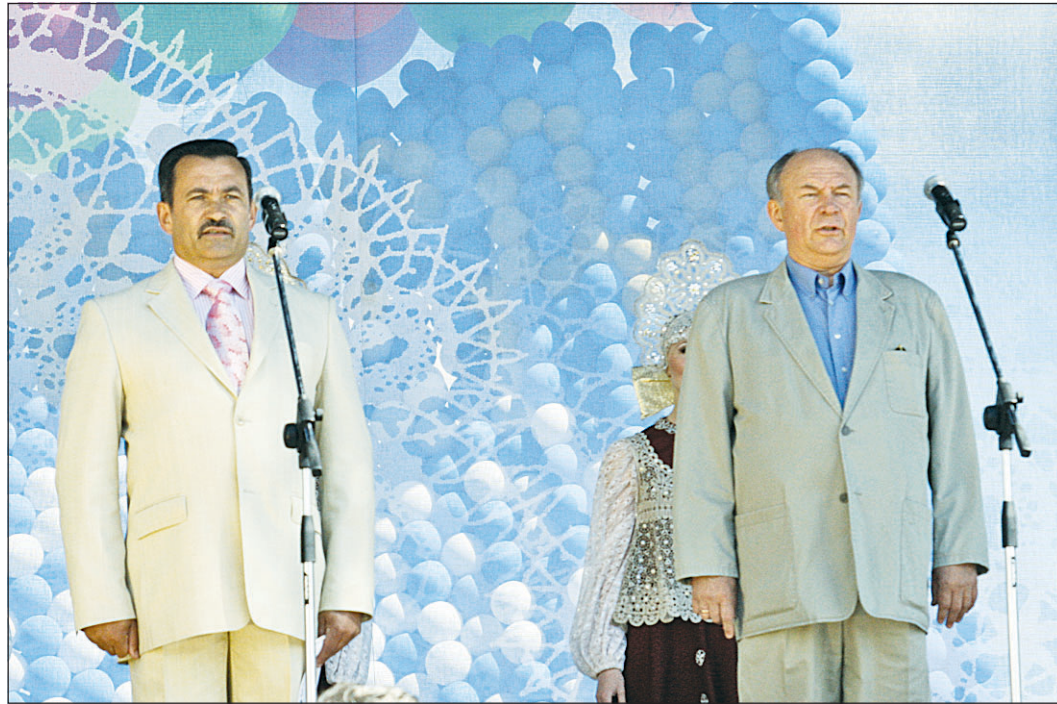
Исполняющий обязанности главы Вологды Валентин ГОРОБЦОВ и Губернатор Вячеслав ПОЗГАЛЕВ торжественно открыли празднование.