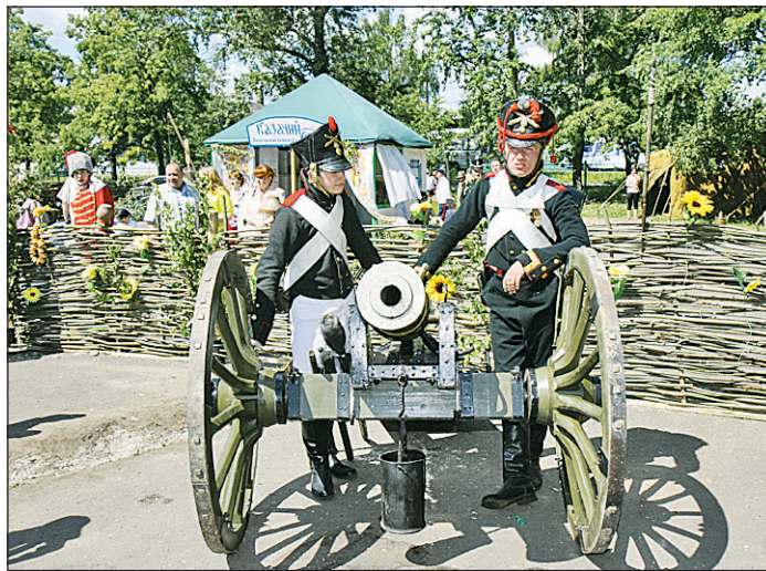
«Казачий курень» под бдительной охраной.

Вологда и вологжане оправдали возложенную на них миссию и оказанное доверие. Как заметили старожилы, такого единения земляков, которых насчитывалось не с одиннадцать тысяч человек, они не видели давно. Торжественная часть собы-