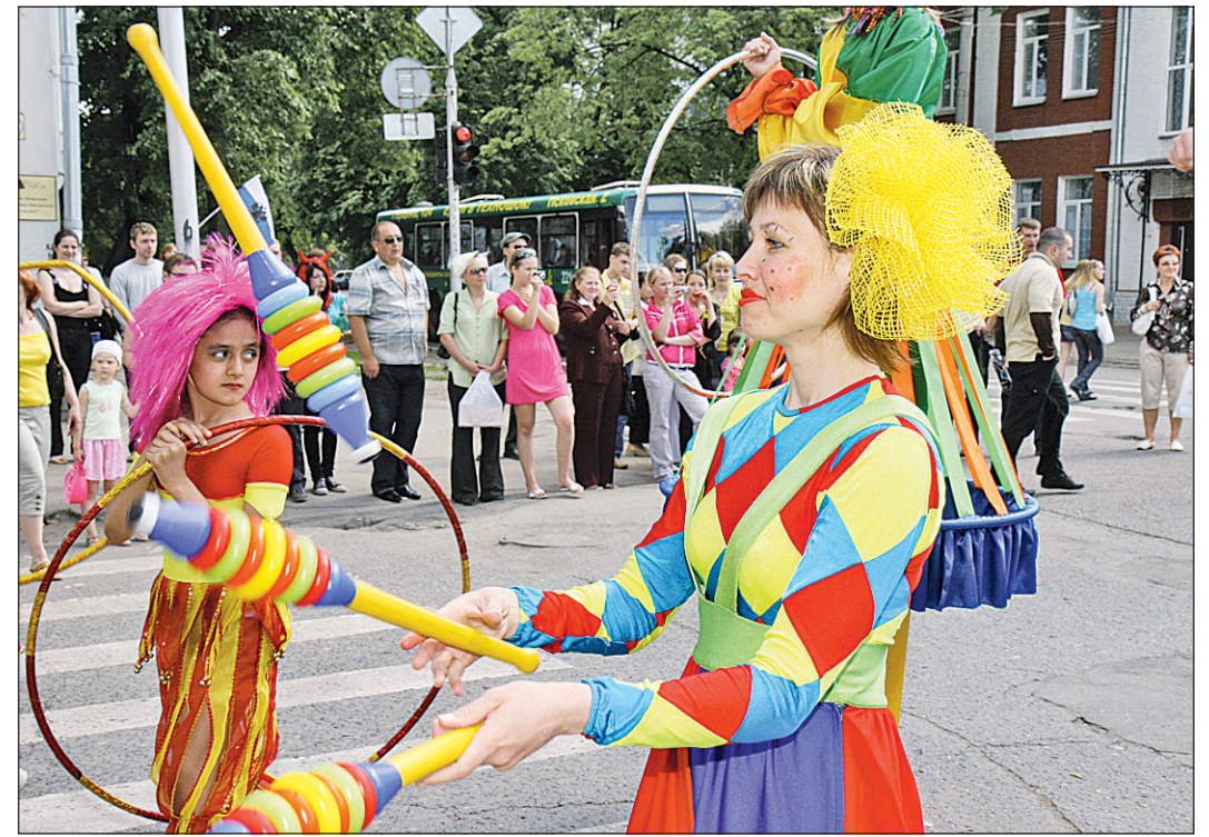
Ах, карнавал, карнавал!

Чем же отличается нынешний праздник от остальных? Во-первых, он действительно стал событием областного масштаба. Во-вторых, заметно расширилась география