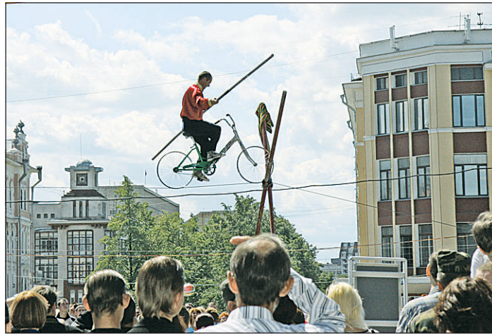
Акробатические трюки юношей-спортсменов не оставили равнодушным никого из прохожих-зрителей.