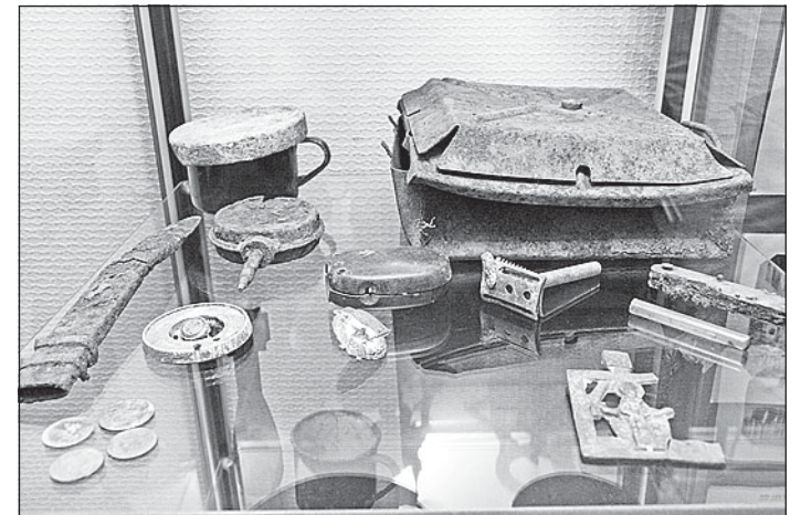
В Музее боевой славы, созданном вологодскими поисковиками, хранятся пробытые каски, солдатские медальоны, оружие, патроны, осколки гранат... Все это они привезли из полевых экспедиций по местам сражений Второй мировой.