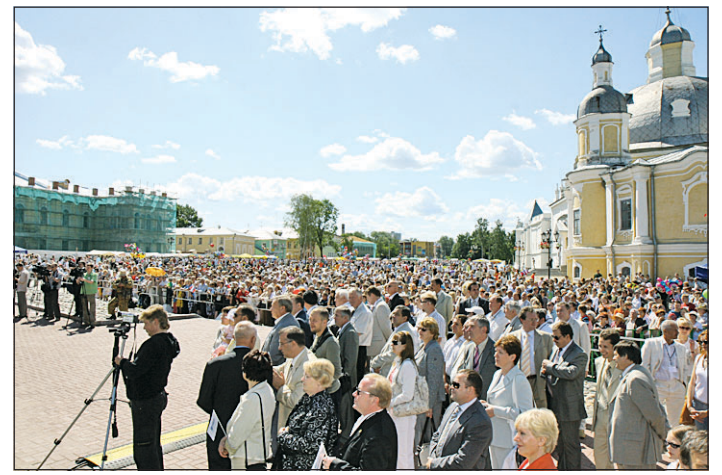
На Кремлевской площади яблоку было негде упасть!