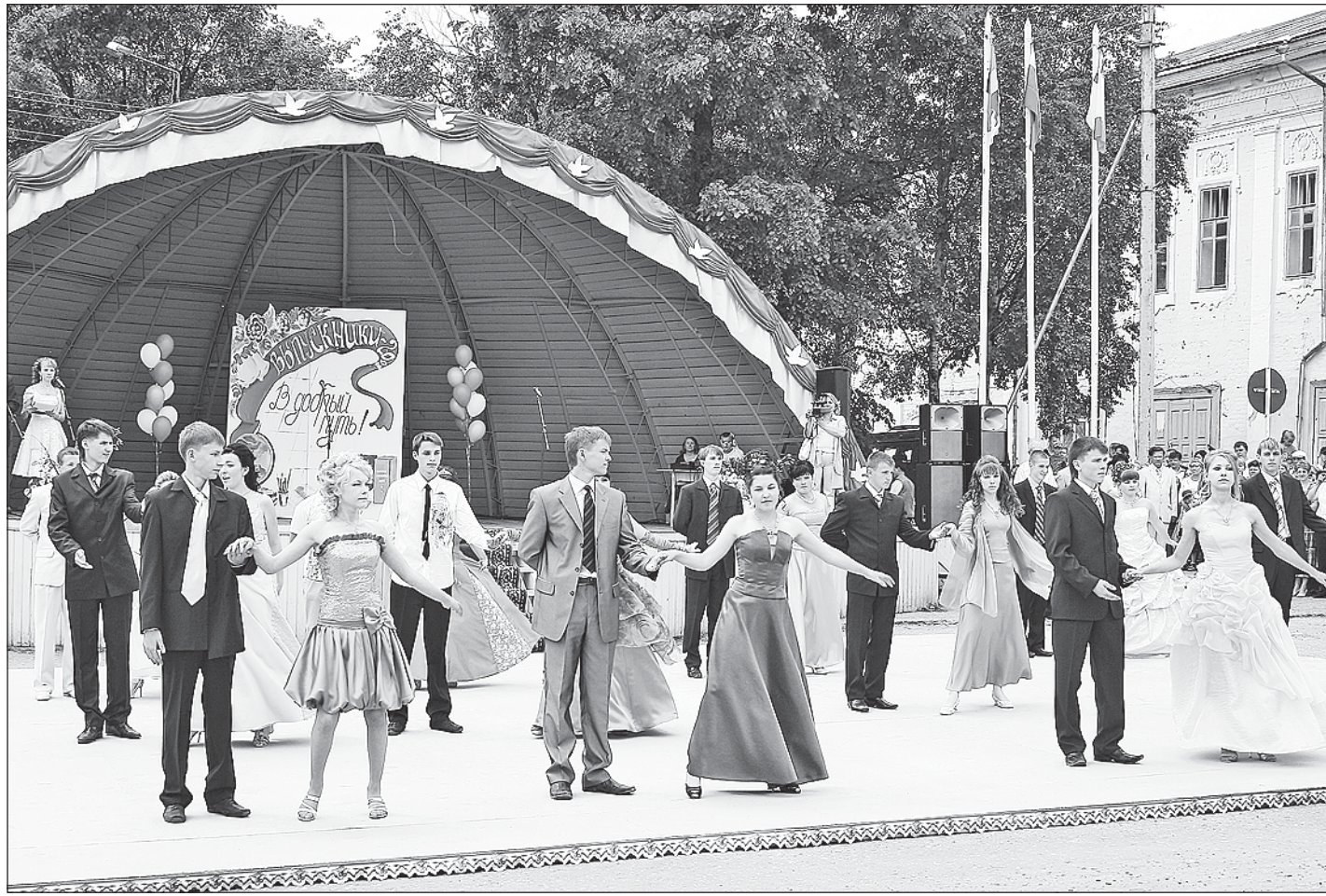
Под звуки нестарящего вальса.

И все же главным событием этого дня по праву стало чествование лучших учеников. Выпускники города, радости и немного смущенные - все взгляды устремлены на них - получили из рук главы города Тотьмы благодарности и грамоты за успехи в учебе, подарки. А сколько радости и гордости было на лицах родителей! Многие не смогли сдержать слезы. Особенно когда глава Тотемско-