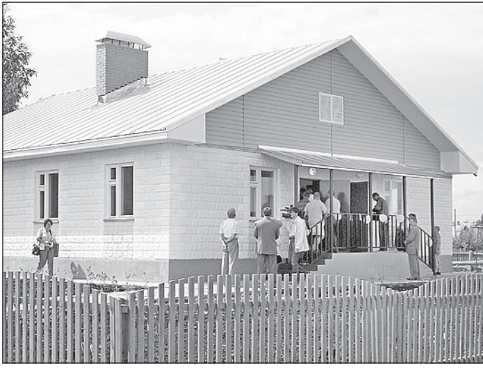
Сразу четыре семьи ветеранов Великой Отечественной справили в этом доме долгожданное новоселье.