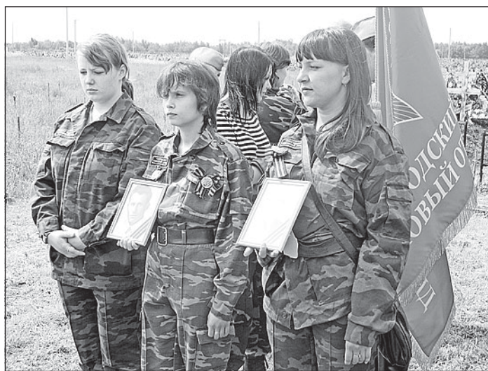
Памяти павших будем достойны!

рее всего, это была немецкая танковая атака при поддержке пехоты, потому что воронки от минометов и артиллерии на местности нет».