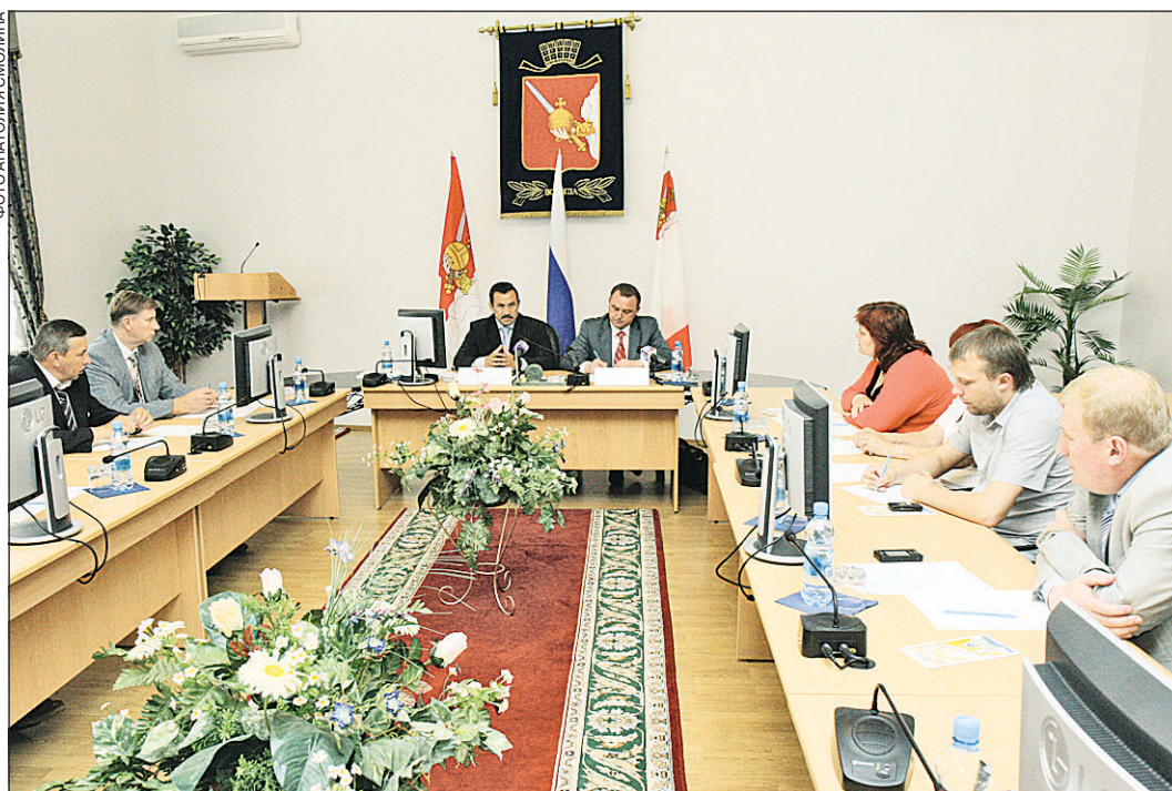
На заседании было поддержано обращение администрации Вологды к Правительству области о выделении 1 миллиарда рублей на благоустройство города.