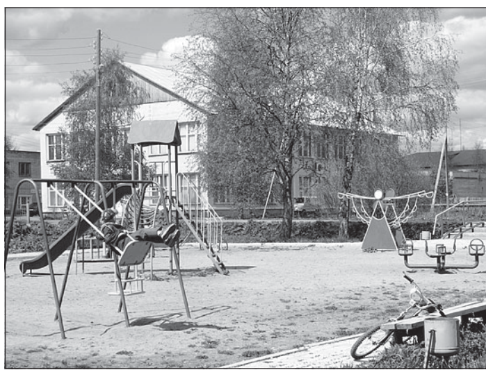
Детская площадка в селе Шуйское.

Междуреченского райпо покупают в Грязовце, Вохтоге, Вологде, Бабаеве и в Устье Кубенском.