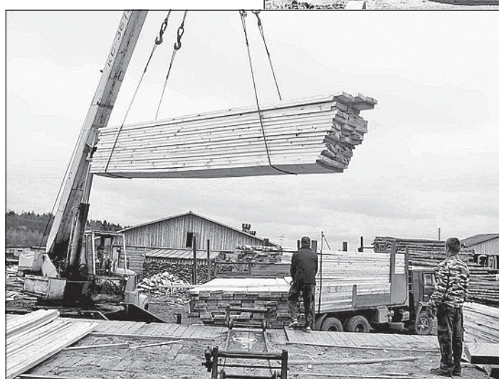
На производстве деревообработки.

большее нет. О своих питомцах рассказывает с любовью: - Порода в основном большая белая, черная и помесь с рыжей... Вот Шлюня стоит, вот Хряпушко - очень сальный, - знакомит с постояльцами двора и помогает сфотографировать поросят.