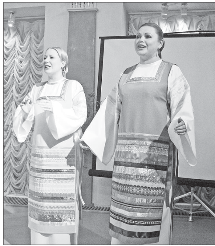
Для участников вечера выступали лучшие артисты Вологодчины.