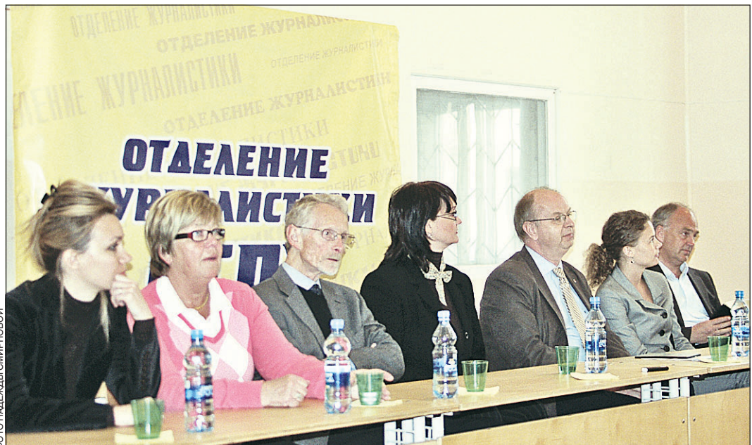
В Вологодском педагогическом университете прошла встреча представителей шведской делегации со студентами и преподавателями этого учебного заведения.