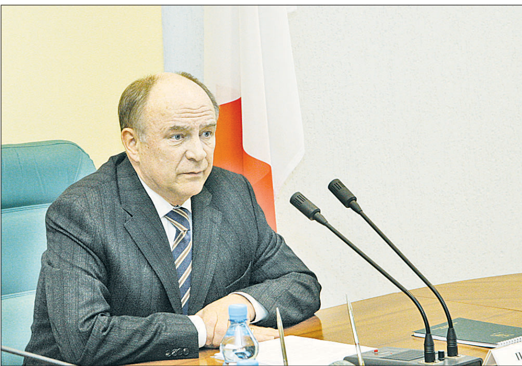
Губернатор Вячеслав ПОЗГАЛЕВ: «Взаимодействие органов исполнительной государственной власти области и командования воинских частей способствует повышению боевой готовности военнослужащих».