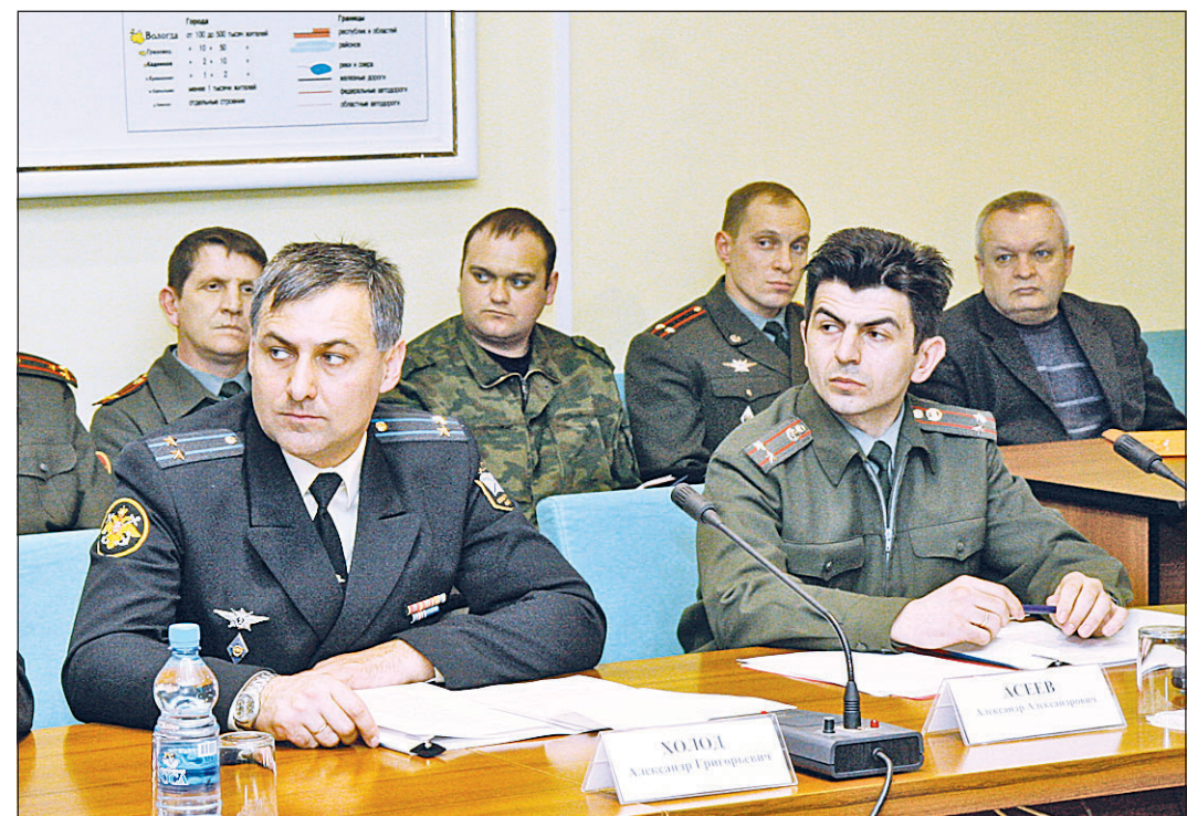
Участники заседания координационного совета рассмотрели ряд наиболее важных вопросов, связанных с положением дел в армии.