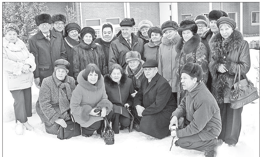
Делегация вологодских ветеранов в городе Оривеси.

В тематическом выпуске «Голос ветерана» № 5 (175) был опубликован материал из цикла «Вологжане в стране Суоми» о пребывании делегации вологодских ветеранов в Финляндии. Предлагаем вниманию читателей очередной материал из этого цикла.