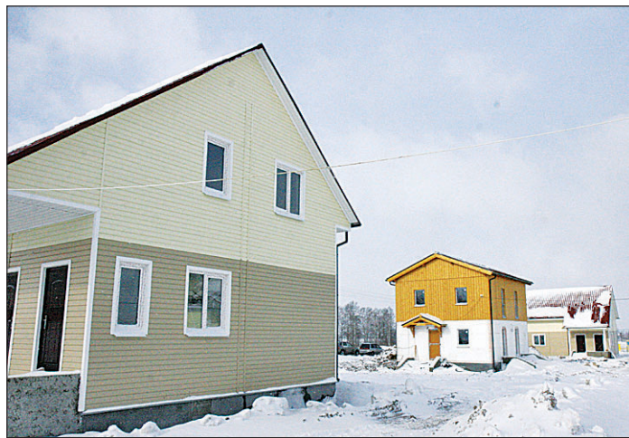
Сотни сельян смогут выбрать здесь для себя дом и по цене, и по вкусу!

Во-первых, написать заявление в районную администрацию и быть признанным нуждающимся в улучшении жилищных условий - в этом случае человека включают в федеральную программу. Сейчас в спис-