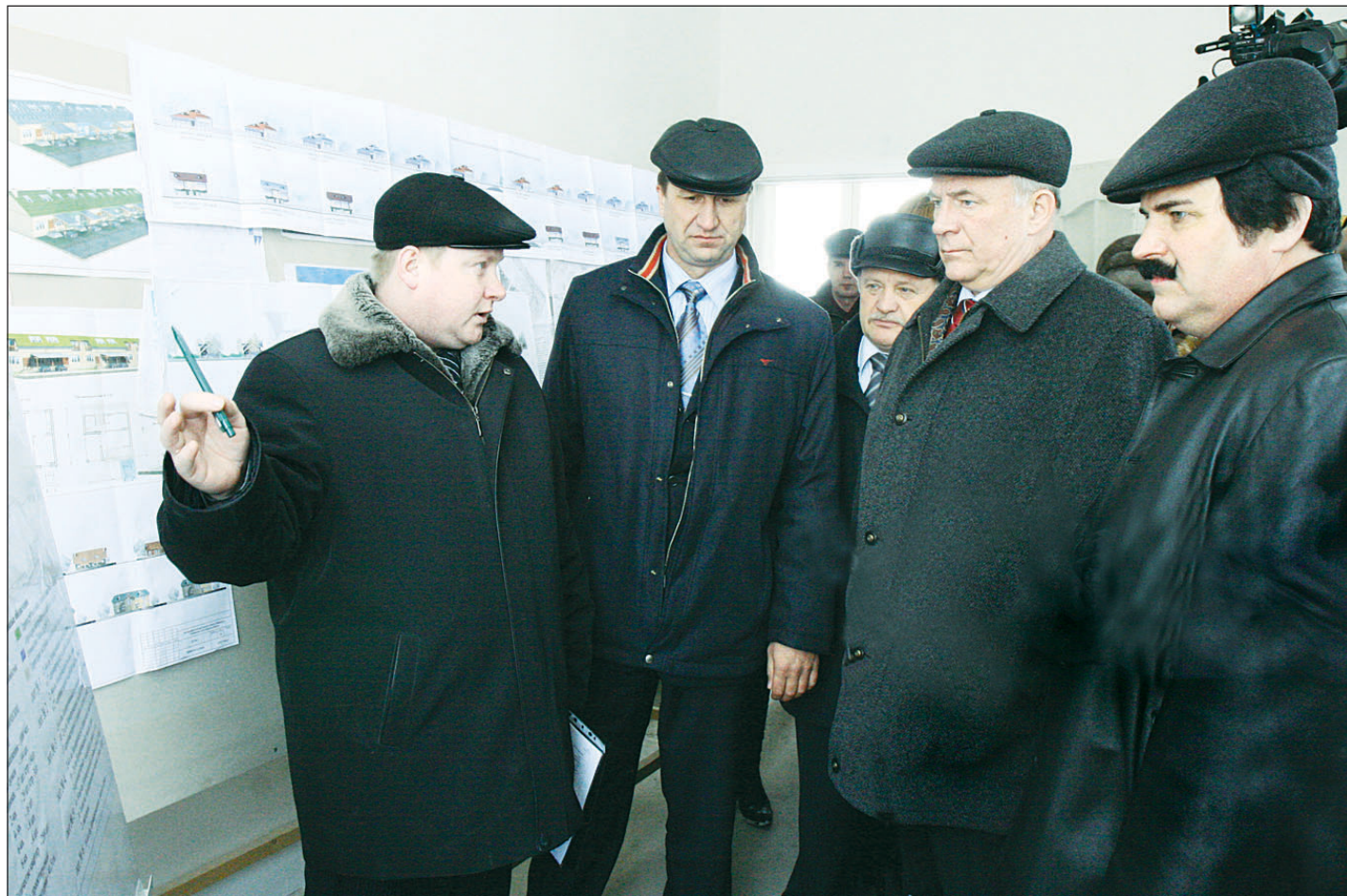
Губернатор Вячеслав ПОЗГАЛЕВ интересуется темпами застройки экспериментального жилого поселка Марфино - Семеново.