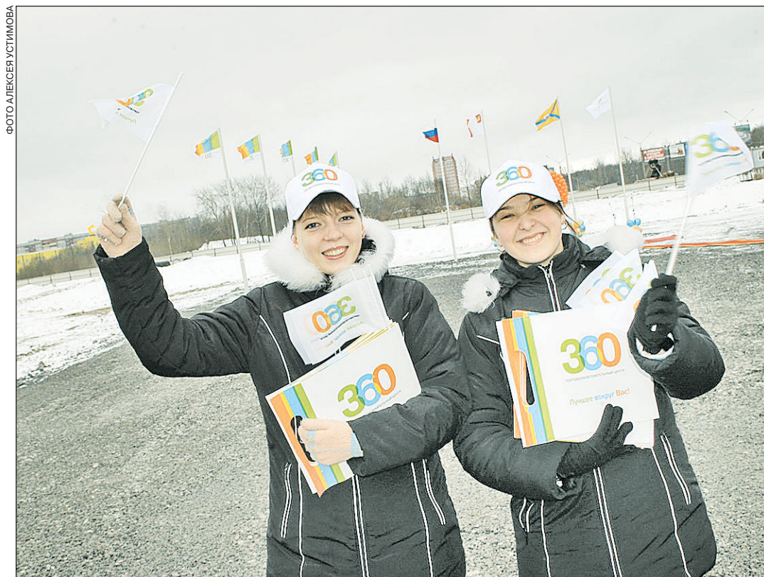
Здесь будет возведен торгово-развлекательный комплекс европейского уровня.