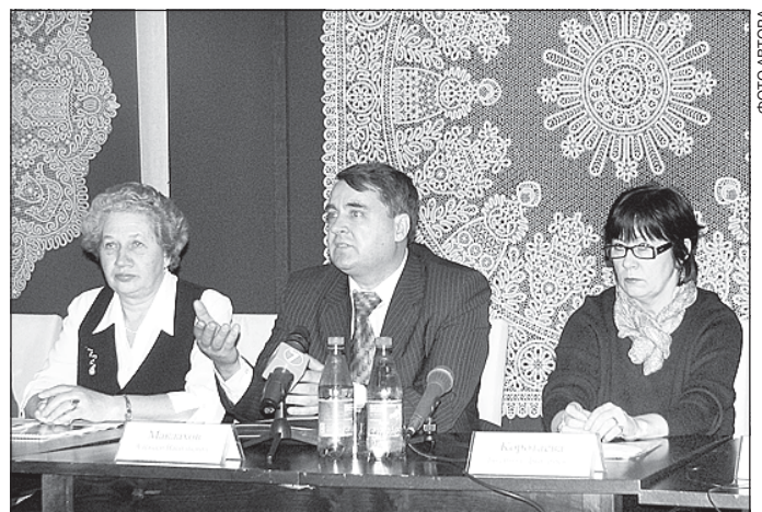
На конференции обсуждались вопросы развития кружевоплетения на Вологодчине.