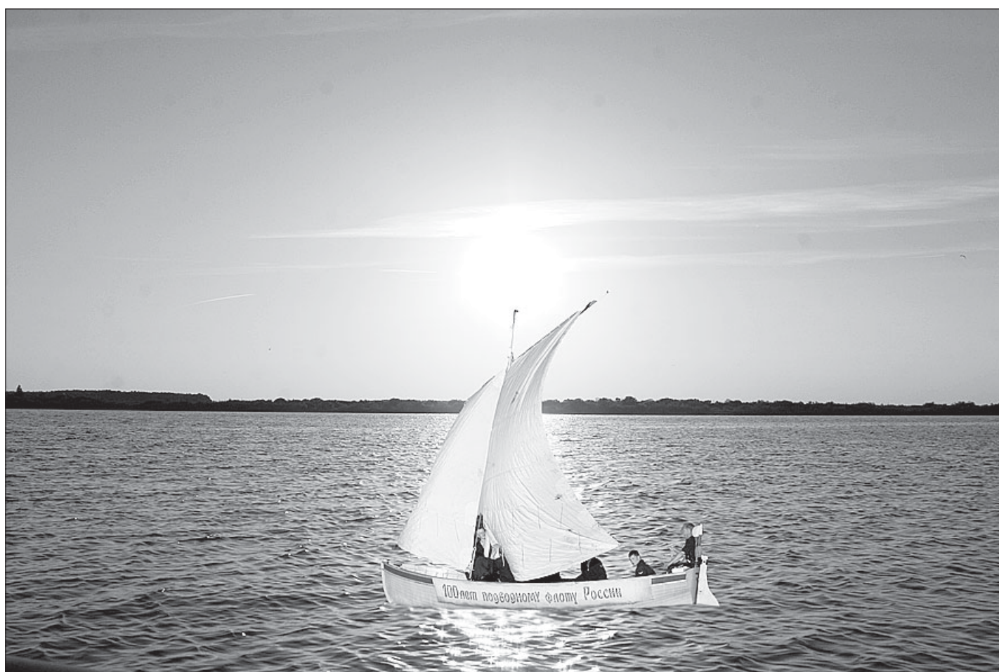
Воображаемое гаврилинское синее море с белым пароходом - Кубенское озеро.