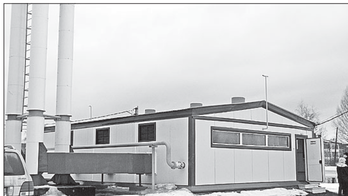
Благодаря вводу в строй новой газовой котельной в домах жителей деревни Коротово появились тепло и горячая вода.

ходится платить 5 тысяч 300 рублей. Однако благодаря субсидии реально Вязаничны платят примерно полторы тысячи рублей. Но и такую квартиру губернатор посчитал завышенной. Вячеслав Позгалев попросил представителей районной администрации подготовить необходимые расчеты по оплате услуг ЖКХ, с тем, чтобы разобраться в этом вопросе. Однако в целом после общения с председателями сельских поселений и представителями промышленных предприятий и общественных организаций работой местных властей глава области остался доволен. «Все эти годы местная власть не сидела сложа руки и не занимала иждивенческую позицию. Самое главное, что удалось сделать, - сохранить сельскохозяйственное производство, - подчерк-