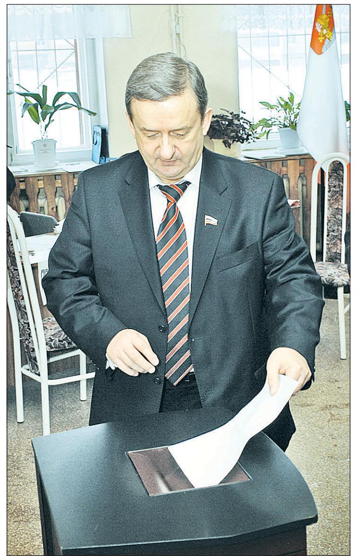
Депутат Государственной Думы Георгий ШЕВЦОВ проголосовал в Череповце.