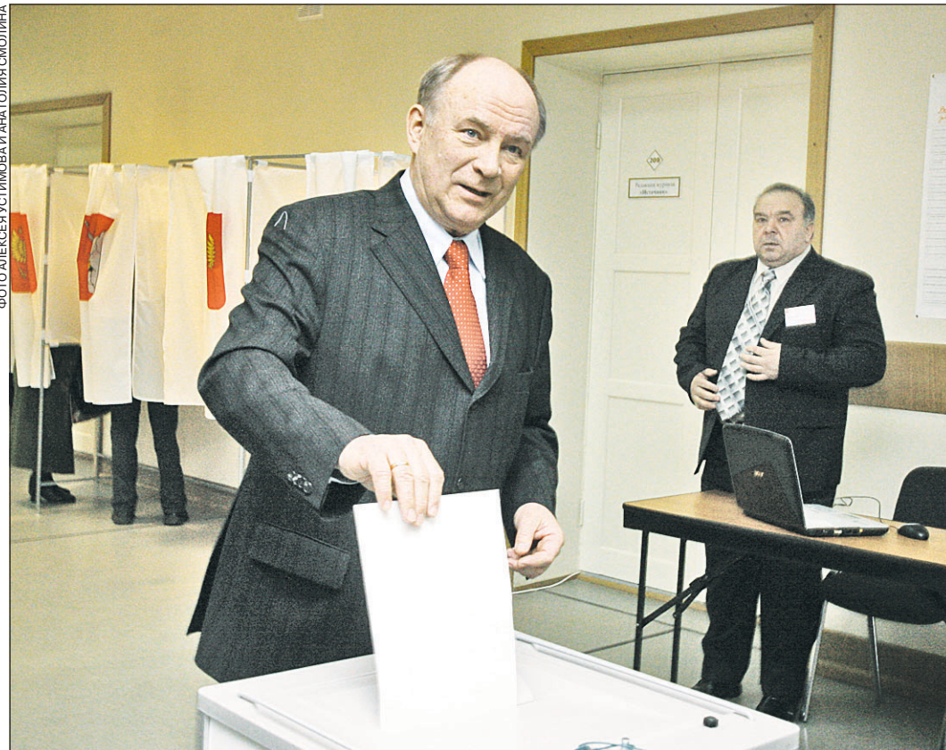
Губернатор Вячеслав ПОЗГАЛЕВ пришел на свой избирательный участок одним из первых.