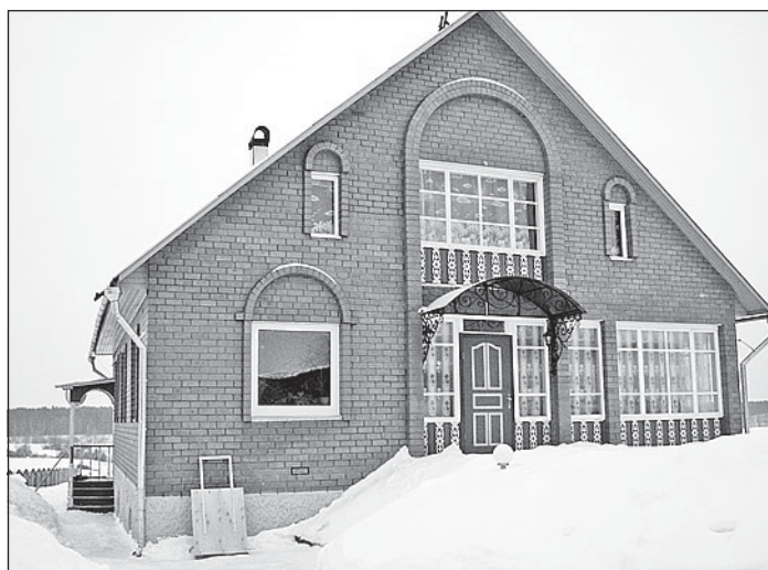
Новый дом семьи Андрушкевичей.

Отремонтировали телятник и ферму. Улучшился уход - выросли надои. В декабре 2007 года приобрели 17 племенных телок - это, несомненно, шаг вперед. В марте они отелятся. От первотелок, конечно, больше надоев ждать не приходится. Но здесь работают на перспективу.