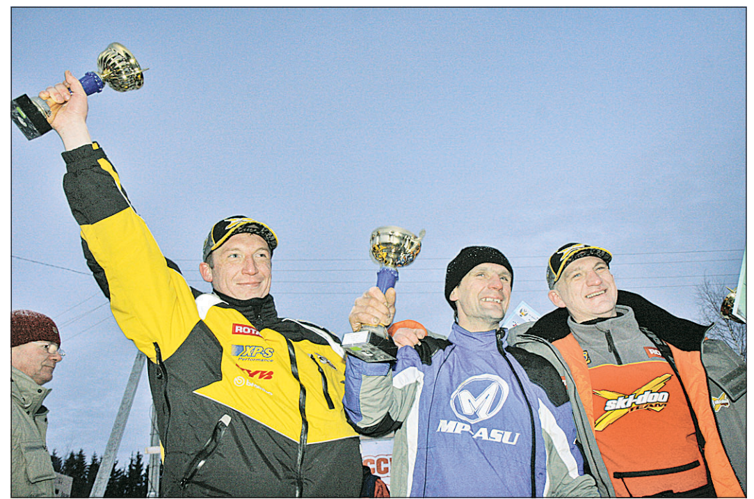
Сладкий миг победы.

Два дня подряд в Кириллове мела метель, что создало дополнительные трудности при подготовке к шестому чемпионату и первенству России по эндуро (соревнования на длинные дистанции) на снегоходах. Но в воскресенье с самого утра погода улучшилась, снегопад с метелью прекратились.