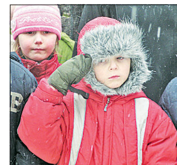
Памяти Героя будем достойны!

Стоит отметить, что в школе № 13, где и учился Андрей, уже восьмой год подряд проходят уроки Памяти, посвященные подвигу бывшего ученика, Героя России. В стенах учебного заведения планируется открыть музей Андрея Завитухина, а на территории школы - установить бюст Героя.