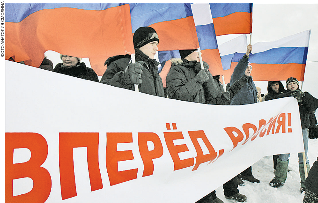
Нынешние гонки проходили в рамках общероссийской акции «Россия, вперед!», которая направлена на поддержку здорового образа жизни, воспитание чувства патриотизма среди молодежи. Участников соревнований приветствовали кирилловские «молодогвардейцы».