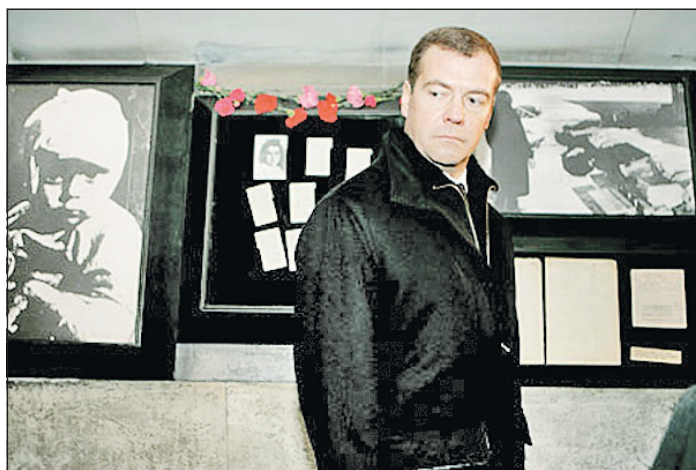
Первый вице-премьер Правительства РФ Дмитрий МЕДВЕДЕВ во время посещения музея на Пискаревском мемориальном кладбище.

Первый заместитель Председателя Правительства РФ Дмитрий Медведев в день 64-й годовщины освобождения Ленинграда от блокады посетил Пискаревское мемориальное кладбище.