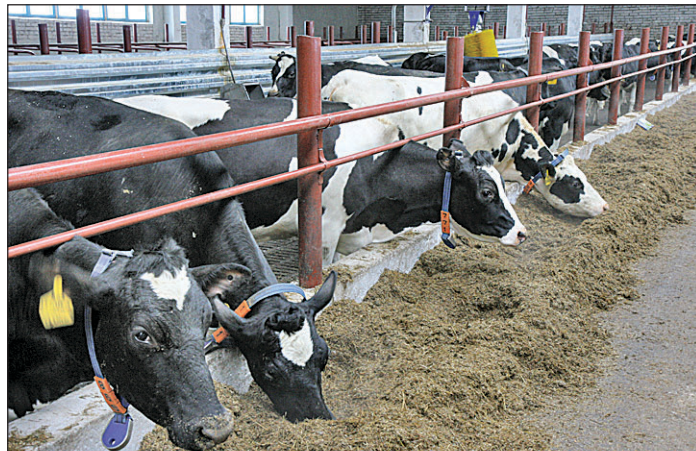
Животные потихоньку привыкают к новшествам и оценивают преимущества прогресса.