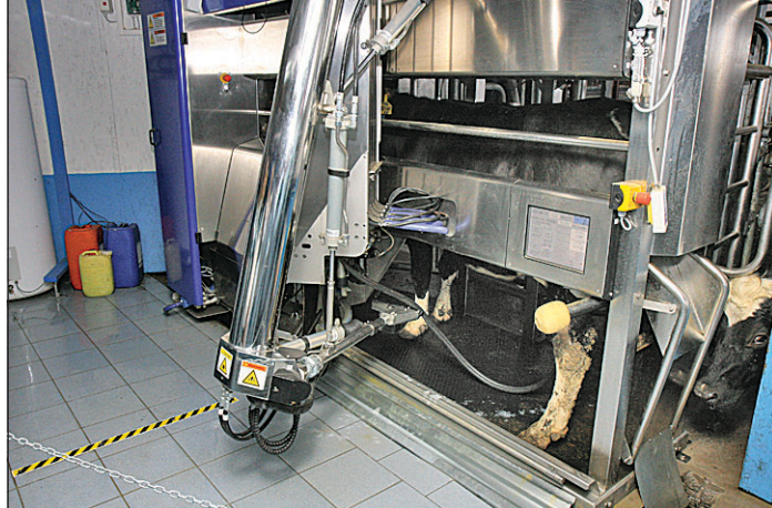
Так выглядят роботы, впервые появившиеся в России именно на территории Вологодской области.