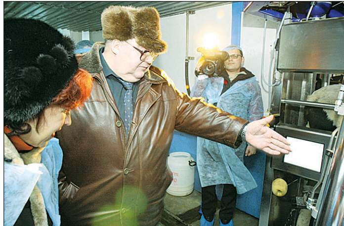
Первый заместитель Губернатора области Сергей ГРОМОВ: «Коровы находятся под наблюдением круглые сутки».