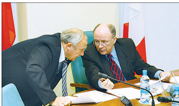
По мнению Губернатора Вячеслава ПОЗГАЛЕВА, эту зиму Вологодчина должна прожить спокойно: оборудованием и топливом область обеспечена полностью.