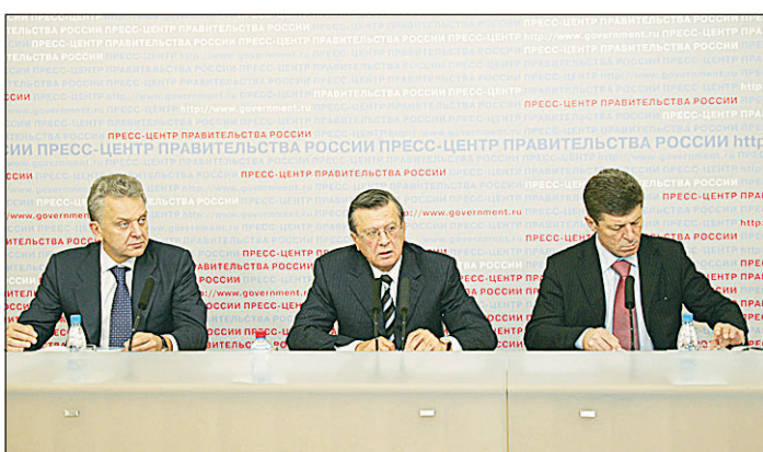
На селекторном совещании, которое провел Председатель Правительства России Виктор ЗУБКОВ, отмечалось, что подготовка регионов к отопительному сезону - вопрос особой важности.