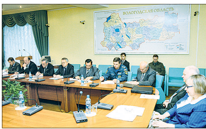
Вологодская область вошла в число 72 российских регионов, принявших участие в работе селекторного совещания.

Вопросы подготовки жилого фонда, объектов социальной сферы и энергетики российских регионов к работе в осенне-зимний период 2007-2008 года обсудил с главами субъектов Федерации в среду Председатель Правительства РФ Виктор Зубков. На селекторном совещании, в котором приняли участие 72 российских региона, о готовности к зиме доложили в том числе главы республик Коми, Марий Эл, Мордовия, Хабаровского края, Воронежской, Ленинградской, Мурманской, Вологодской областей.