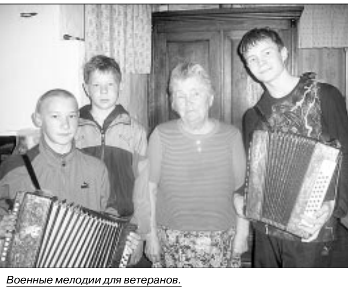
Военные мелодии для ветеранов.