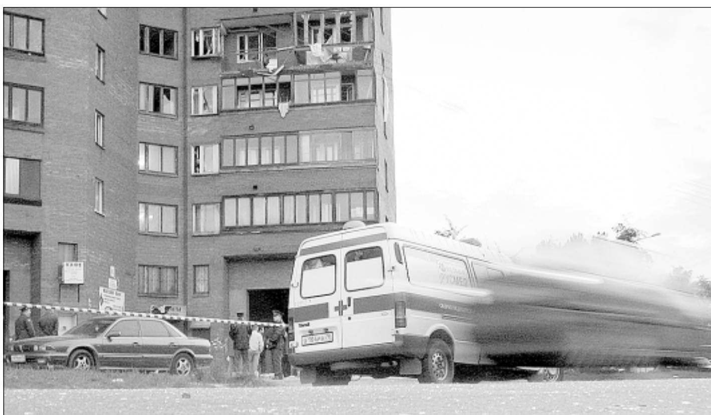
Молниеносность - одна из главных характеристик работы «Скорой помощи».

...С января 2007 года вступили в действие новые стандарты для врачей «скорой». Теперь медик обязан, например, измерить у пациента уровень глюкозы в крови, а кишечные инфекции лечить прямо на месте. Сами врачи экстренных бригад говорят, что эти обязательные, но не всегда нужные процедуры могут растянуть время обслуживания одного пациента с 15 минут до 40-45. А действительно нуждающийся во врачах «скорой» больной может их не дожидаться.