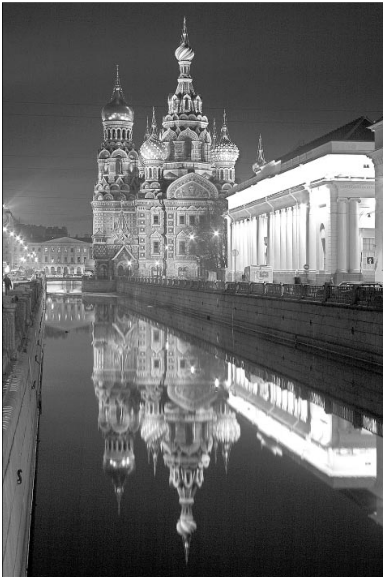
Декоративная подсветка значительно увеличивает потребность города в электричестве.

Теперь планы поставок разработали на период до 2015 года с перспективой еще на 10 лет (раньше они рассчитывались лишь на один год). Документ предусматривает реконструкцию сетей тепло- и газоснабжения и ряд других инвестиционных проектов. Если потребность в газе в 2007 году составляет 10,8 мил-