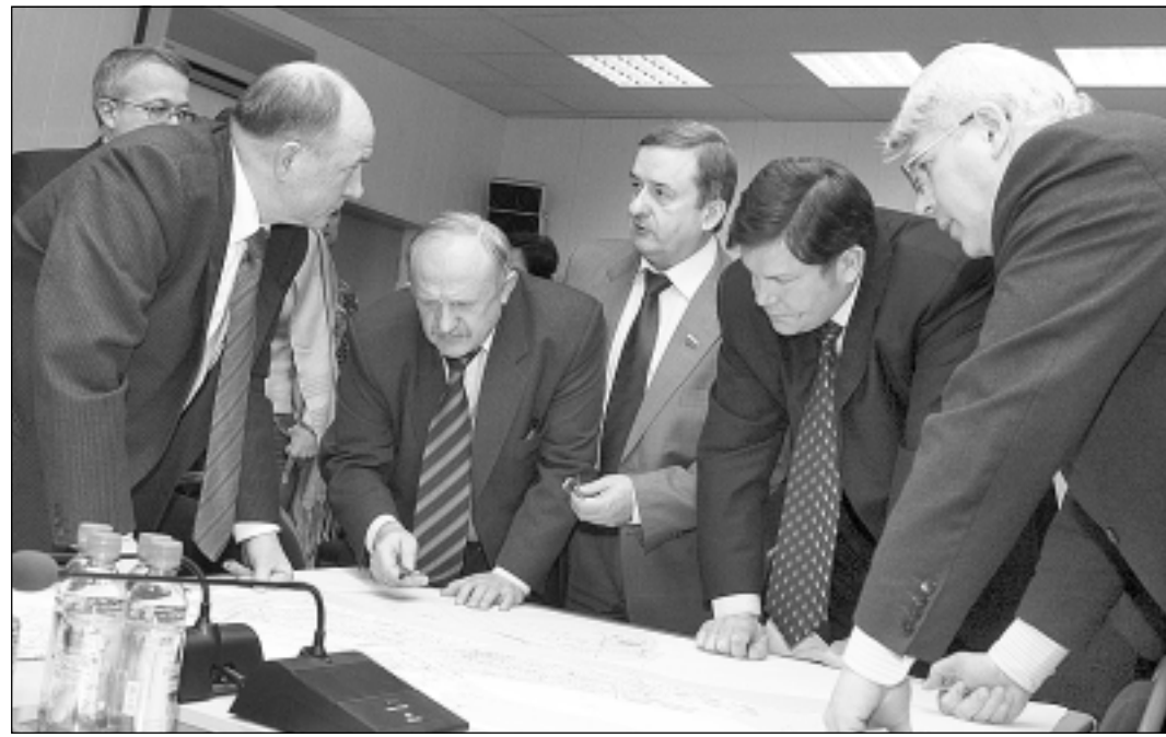
Во время совещания рассматривались сразу несколько очень важных для города металлургов проблем.

Осенью, ко Дню города, в Череповце появятся полностью отремонтированный Камерный театр и новый волейбольный центр, Лучший на Северо-Западе. Принципиальное решение о сроках сдачи и финансировании этих объектов было принято на выездном заседании, которое провел в Череповце Губернатор области Вячеслав Позгалев. Обсуждались на нем и другие городские проблемы. В совещании приняли участие депутат Госдумы Георгий Шевцов и исполняющий обязанности мэра Череповца Олег Кувшинников.