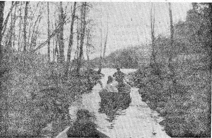
ФОТОГРАФИРУЕТ ЕВГЕНИЙ СОКОЛОВ.