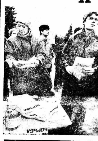
Письмо из редакции