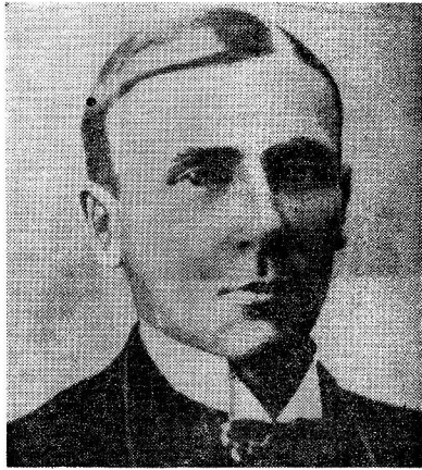
тафор: судьбы эти и впрямь рассеялись «в катакомбах, пещерах».

В «катакомбах» ГУЛАГа бесследно сгинули многие и многие. Но все же и в тех обстоятельствах играющий Случай кое-что сберег. Свидетельство тому — свежая публикация в 8-м номере «Нового мира» за прошедший год, издаваемом почти на полгода, подборки лагерных стихов строителя Беломорканала поэта Г. Оболдуева: стихи эти несут в себе многие приметы поэзии Серебряного века.