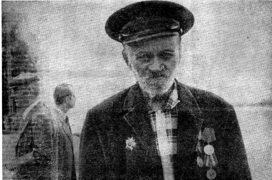
● Окончание. Начало на 1-й стр.

вокзале города сами по себе стали частью праздничного действия.