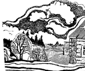
Рис. Г. ЛЕВТЧЕНКО.