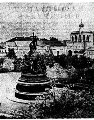
НРАСИС Новгородский Кремль. Все здесь воссоздано и возмочено. На переднем плане синица, сажанная в память «Тысячелетия России», на заднем — знаменитую Софию, памятник русского зодчества XI века.