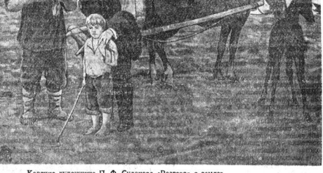
Картина художника П. П. Судакова «Работник со змеи».

В октябре 1920 года в речку в П. Вересиковском сезде комсомол в П. Ленин говорил молодежи: задана цель, в том, чтобы учиться. Советская молодежь свято хранит этот завет Ильича и упорно претерпевает все трудности и лишения, чтобы получить образование без отрыва от производства, отходя в вечерние школы, заочные техникумы и институты. Далеко за пределами ходить не надо; на нашем заводе учатся каждый пятый рабочий. Большинство это, конечно, молодежь. Особенно много молодежи и девушек занимается в вечерних школах рабочей молодежи. Получив аттестат зрелости, многие из них продолжают учебу в заочных техникумах в вузах, становятся специалистами в различных областях техники. Недавно в нашем заводе не стало никого из молодежи. Особенно много молодежи и девушек занимается в вечерних школах рабочей молодежи. Получив аттестат зрелости, многие из них продолжают учебу в заочных техникумах в вузах, становятся специалистами в различных областях техники. Недавно в нашем заводе не стало никого из молодежи.