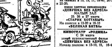
Волгодонская областная киноплатформа получила и выпускает на экраны города и области новый художественный кинофильм киноплатформы «Девушка без адреса».

получила и выпускает на экраны города и области новый художественный кинофильм киноплатформы «Девушка без адреса».