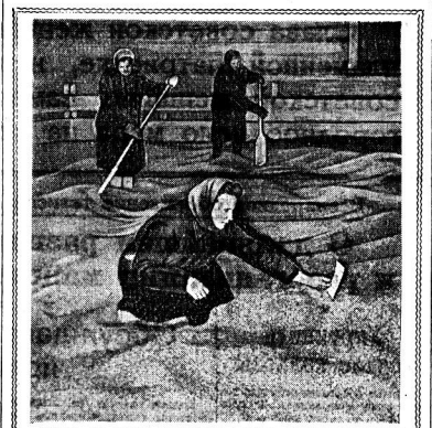
Семена по праву считаются «золотом» фермы. «Что посеешь, то и пожнешь» — великая истина. Колхозники и комсомольцы с любовью относятся к делу посева семян...