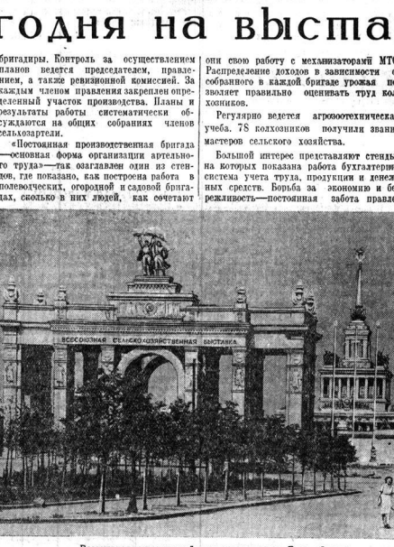
Всесоюзная сельскохозяйственная выставка. Главный вход.

Многим колхозам сегодня навязана послушать конкретные пособия в правильной организации работы правления и ведения всего хозяйства. (ТАСС).