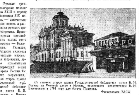
На снимке: старое здание Государственной библиотеки имени В. И. Баженова в 1794 году под руководством архитектора В. И. Баженова

(К 150-летию со дня смерти В. И. Баженова)