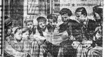
Принес своей номер газеты работы парня механического цеха фермы имени Желябова...