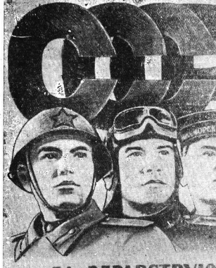
План работы художника В. Корсакова, вымышленный материал от «Искусства»

Восстановление первой очереди Каляевской электростанции. КАЛАНЕДА, 17 февраля. (ТАСС). Завершено восстановление первой очереди Каляевской ТЭЦ. Это достигнуто благодаря тому, что электростанционные заводы выпустили больше энергии, чем в прошлом году.