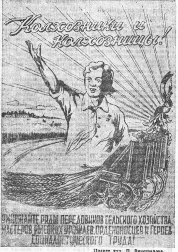
Пикет ут. П. Парасковья.

Рабочий день установлен в 6 часов утра до 8 часов вечера. 1 августа началась жатка. На участок пришли все, как один, и с великим воодушевлением взялись за работу. Да жатка такая — полна никто не ушел. По плану нужно было выполнить 1000 норм. Но вся жатка была в работе!