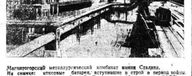
Магнитогорский металлургический комбинат имени Сталина. На снимке: котельная, батареи, вступающие в строй в первый год.

В республике имеются огромные запасы алюминия, никеля, марганца, меди, свинца, золота, фосфорита, слюды, графита, кварца, золота, урана, природного урана, называют «кладовой минеральных богатств нашей Родины».