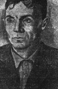
Рисунок П. Виноградова

Председатель колхоза имени 17 партийного съезда. Председатель колхоза имени Николая Александровича Соколова. Под его руководством колхоз одним из первых в районе, к 1 октября, выполнил план хлебозаготовок.