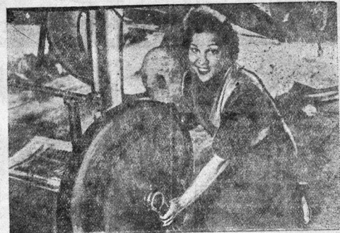
В республиканской Испании. Женщины республиканской Испании работают на предприятиях оборонной промышленности вместо мужчин, ушедших на фронт.

Итальянские фашистские газеты проявляют недовольство в связи с отсрочкой признания за генералом Франко прав воюющей стороны. «Трибуна» заявляет, что Чемберлен, приехав в Париж, убедился в тупом положении Даладе и у него нехватили смелости настаивать на предоставлении Франко прав воюющей стороны».