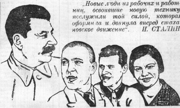
Рис. П. Рыбкина.

Четвертый год стахановского движения должен быть годом массового перехода пехов, предприятий, колхозов, лесхозов, МТО и сплошной стахановской работе, годом новых, еще более грандиозных побед социализма.