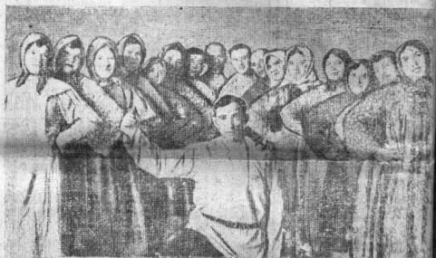
Участники первой дорожной олимпиады художественной самодеятельности строительства вторых путей Данилов - Архангельск. Хор первого прорабского пункта 2-го строительного участка (руководитель т. Филатов) получилший первую премию 600 рублей. Хор выделен на общедорожную олимпиаду.