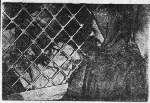
В Вологодском зоологическом саду. На снимке: старшая работница зоосада у влетки волчицы.

Начеян ряд новых интересных событий. Так, например, будут консервироваться искусственным холодом грибы в свежем виде. Ягоды рябины, которыми так богата наша область и которые ежегодно без всякой пользы продаются в громадном количестве, будут перерабатываться в рыбачью пасту—ценный продукт для кондитерской промышленности. Из яблоков личков законсервируют 40 тонн яблоков теста. Продажата же законсервировать до 5 тонн ячм. шишковица, ячмюшки, как известно, незначительно высокую витаминность.