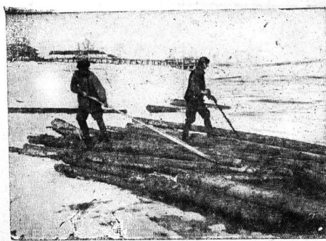
Сплавщики Севера за подготовкой ценного еловатника на лесной набережной, у транспортера биража.