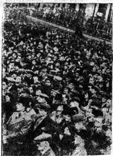
В Лондоне на Трафальгарской площади состоялся грандиозный митинг протеста против захвата Австрии войсками Гитлера.

Какаву империалистической войны Хауз выступает в качестве сторонника активного вмешательства США в мировую войну. В годы империалистической войны Хауз совершает поездки в Англию и Францию для ведения переговоров об условиях вступления США в империалистическую войну на стороне Антанты. Хауз участвовал в качестве представителя США в переговорах по установлению перемирия с центральными державами и в переговорах по заключению Версальского договора, а также принимал участие в разработке устава Лиги наций.