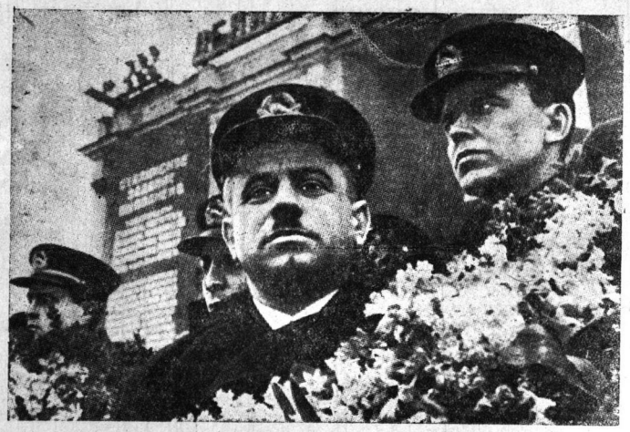
17 марта в Москву прибыли победители Северного полюса, отважные герои страны социализма—Ишангай, Ширшов, Кренкель и Федоров. На снимке (справа налево): Э. Т. Кренкель, Герой Советского Союза И. Д. Пашанин, Е. К. Федоров и П. П. Ширшов на трибуне во время торжественного митинга на Комсомольской площади.