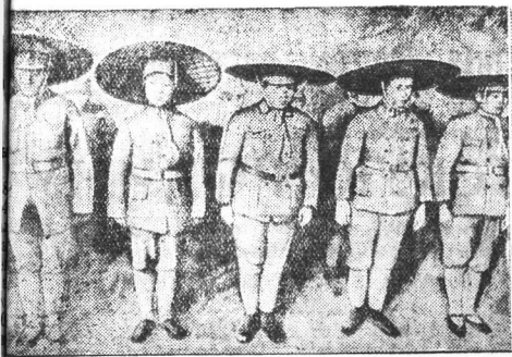
Китайские девушки из добровольного женского отряда китайской народно-революционной армии. Они метко стреляют из винтовок и пулеметов и выполняют самые опасные боевые поручения.