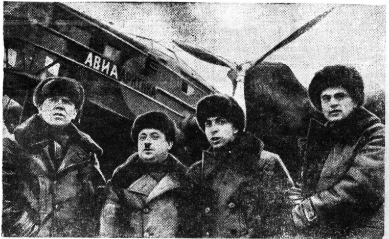
Товарищи Кренкель, Папанин, Федоров и Ширшов на Центральном аэродроме в Москве перед взлетом на Северный полюс.

Приблизается весна—первая весна третьей пятилетки. Эту весну многомиллионные массы колхозников, трактористов, агрономов, комбайнеров встречают под лозунгом шершавеньких колхозов (Краснодарский край)—начать социалистическое соревнование за сталинский урожай в 7—8 миллиардов пудов зерна, за вымоклоурожаи всех культур, за новые победы социалистического земледелия.