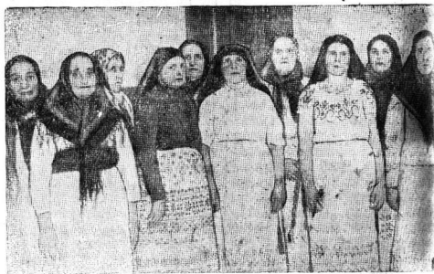
Хор Луковецкого сельсовета, выступавший на районной олимпиаде в г. Череповце 11 декабря, кандидат на областную олимпиаду