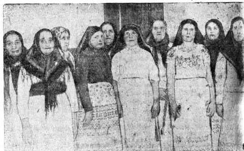
Хор Луковецкого сельсовета, выступавший на районной олимпиаде в г. Череповце 11 декабря, кандидат на областную олимпиаду

Постановка в целом показывает хорошую работу коллектива и опытное руководство режиссера тов. Ланова. А. АСКОЛЬДОВ.