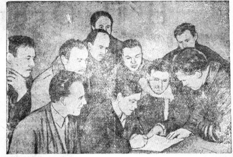
Колхозники Подольского сельсовета, Череповецкого района, обратились в письме ко всем колхозникам Вологодской области с призывом лучше подготовиться к весне, организовав борьбу за высокий урожай. НА СНИМКЕ: участники совещания подписывают письмо.

(Принято на совещании стахановцев, бригадиров, председателей колхозов и членов полеводческой секции Подольского сельсовета, Череповецкого района).