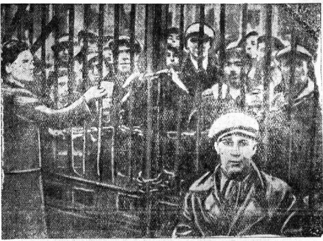
Борьба против чрезвычайных декретов во Франции. На СИМКСЕ на одном из предприятий Анжера, крупного центра каменноугольной промышленности Франции, бастующие рабочие заняли завод. Жены рабочих передают им продовольствие.

ропом и Жоржем Бонна, были рассмотрены основные европейские проблемы и особенно проблемы, непосредственно касающиеся политических и экономических отношений между Францией и Германией. Было признано той и другой стороной, что развитие отношений между двумя странами на основе формального признания их границ посягают не только на совместный интерес, но и будет способствовать существенным образом сохранению мира. В этом духе министры иностранных дел обеих стран подписали декларацию, которая учитывает особые отношения обеих правительств с третьими державами, выражает их волю к мирному сотрудничеству в духе взаимного уважения и взаимной помощи, важный шаг на пути общего умиротворения».