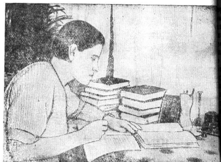
Врач-коммунист Череповецкой межрайонной больницы Лова за изучением Истории партии.