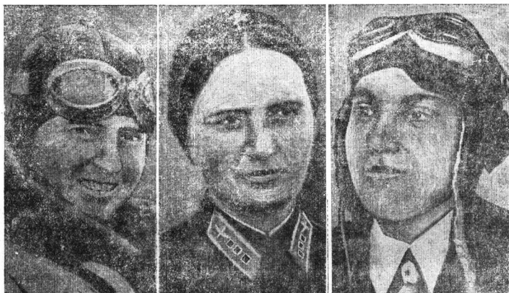
Экипаж самолета «Родина» на Щелковском аэродроме перед тренировочным полетом. Справа на фото: командир самолета летчик В. С. Гризодубов, штурман старший лейтенант М. М. Раскова, 2-й пилот капитан П. Д. Осипенко.