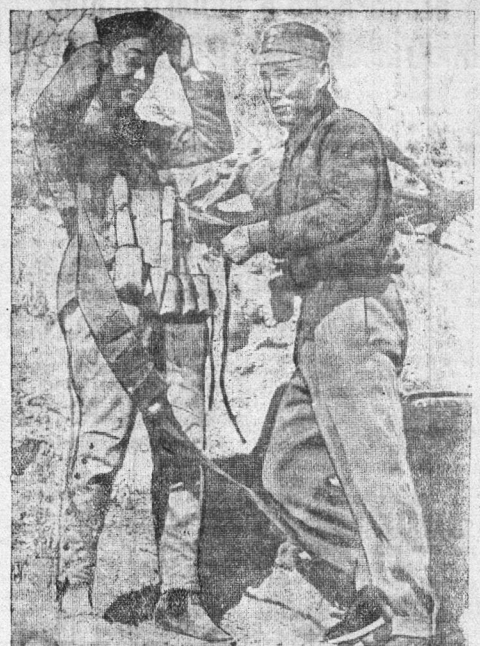
Китайские женщины героически сражаются на фронтах, защищая свою родину от японских захватчиков. На снимке: женщина-боец китайской армии получает снаряжение перед отправкой на фронт.

ЖЕНЕВА, 25 сентября. Первый делегат Китая в Лиге наций Веллингтон Ку рунга генеральному секретарю Лиги ноту, в которой сообщает о новых случаях применения японцами отправляющих газов на фронтах Центрального Китая.