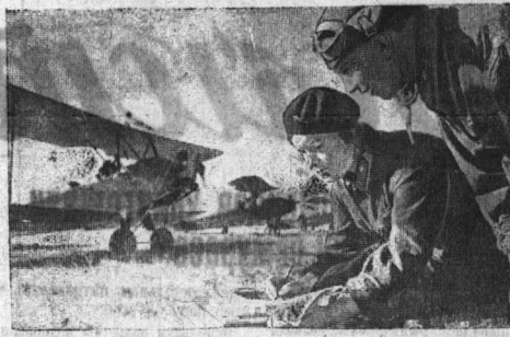
Комсомолец-учесть Ленинградского аэроклуба проходит летную практику.