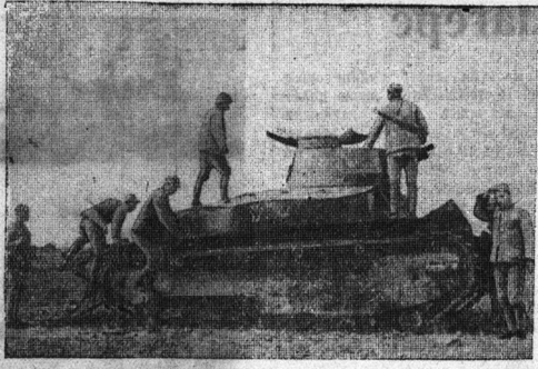
К военным действиям в Китае. На снимке: бойцы китайской армии осматривают танк, захваченный в боях с японскими интервентами.

ланским народом. Подчерывая, что «Юманите» проводит большую кампанию по организации помощи республиканской Испании. Кашен указывает, что 6 ноября состоится интернациональный день солидарности с испанским народом.