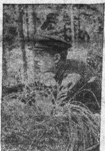
Северо-западная граница. В дозоре.

Газета «На защиту родины». № 2. 8 августа 1938 г.