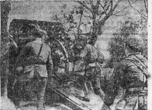
На снимке: китайская артиллерия на позиции.

Нейссе, Пленхальсе, Козеле, Леобшуде и других городах. Аресты вызвали всеобщее негодование и сильное волнение среди населения, еще более усилившееся, когда стало известно, что арестованные подвергаются в тюрьмах зверским пыткам. Независимо в одном из городов Верхней Силезии на похоронах рабочего, умершего в тюрьме от пыток, присутствовала огромная толпа, настолько возбужденная, что местные фашистские власти не решились применить к ней какие-либо репрессии.